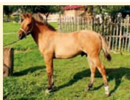
Hříbata pro western . Plaváci po špičkovém hřebci APH MG Doc Joe Chex, import Kanada, 2x mistr ČR - haltr, 2x vicemistr reining a pleasure, vítěz Brno trophy. Z matek Fjord. Odběr 10/06, cena k jednání: hřebeček 20 000 Kč, kobylka 25 000 Kč, okr. UO, tel: 603378043, e-mail: 1joy@centrum.cz 11J54