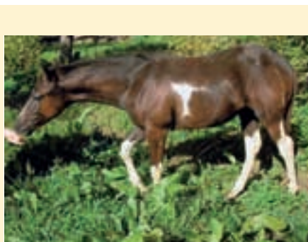
APH hřebec , nar. 19.4.06, o: Jack D'Sanbars, m: po Mr. Espresso, pastevní odchov, velmi hodný, vychovaný, ošetřován dětmi, krásný, osvalený. Bližší info na 777551576, cena 95 000 Kč. 11J52