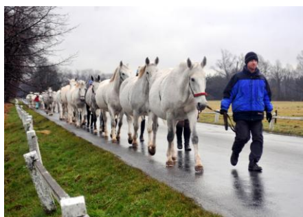
stěhování klisen do Selmic

V průběhu prosince a ledna se muselo ze stájí v Kladruzech nad Labem přestěhovat 220 koní do jiných stájí v majetku NHK ve Slatiňanech, Slavicích, Heřmanově Městci, Selmicích, do Hospodářského dvora a na Paddock.