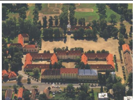
pohled na areál kladrubského hřebčína