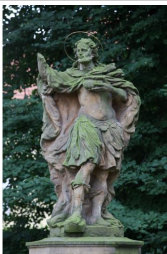
socha Sv. Donáta

Předmětem projektu je regenerace celkem 17 objektů, z toho 16 národních kulturních památek a 1 kulturní památky (lesovna). Součástí projektu je rovněž úprava dalších pěti volných prostranství nebo restaurování sousoší. Jedná se o stáje, zámek, kostel, kapli, vodárenskou věž a kočárovnu v Kladrubech nad L., hřibárnu Františkov v Selmicích a stáje Josefov. V době udržitelnosti je plánováno navýšení počtu návštěvníků o 2.850 ročně oproti roku 2005 (na 15.800 osob).