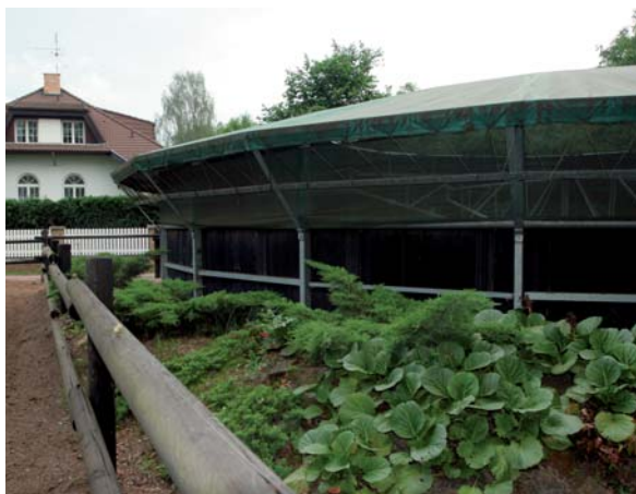
Kolotoč stojí hned vedle pískové jízďárny, vzadu je část domu majitele areálu.