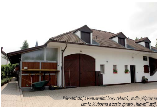
Původní stáj s venkovními boxy (vlevo), vedle přípravná krmiv, klubovna a zcela vpravo „hlavní“ stáj.