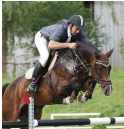
☛ Klisna Areca (Catango Z, Argentina po Argentinus) v ST v Písku.