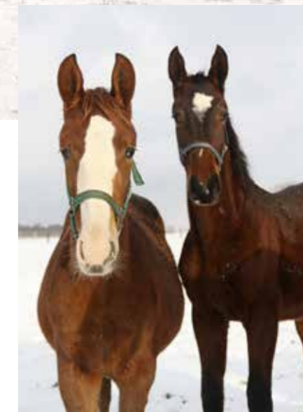
Dva ze synů Volontera-T.