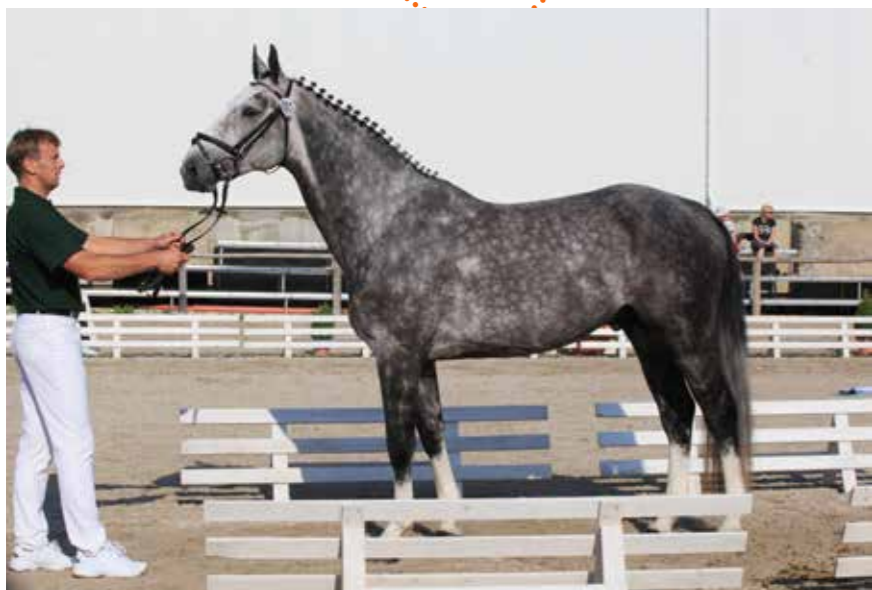
☛ Přehlídka výkonných koní ČT vloni ve Zduchovicích, plemenný hřebec Cocain.

hřebců v Brně a byl tam vyhodnocen jako nejlepší kůň českého chovu. V roce 2013 se účastnil 70denního testu v Písku, kde obsadil celkové šesté místo. Vloni se kvalifikoval do finále Kritérií mladých koní. V jeho sedle startuje sám chovatel a majitel.