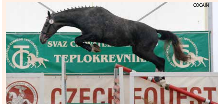
☛ Dvouletý Cocain na výběru hřebců v Brně, nejlepší kůň českého chovu. Spolu s Caletem a Cocou asi nejvýraznější produkty Hrnčířova chovu.