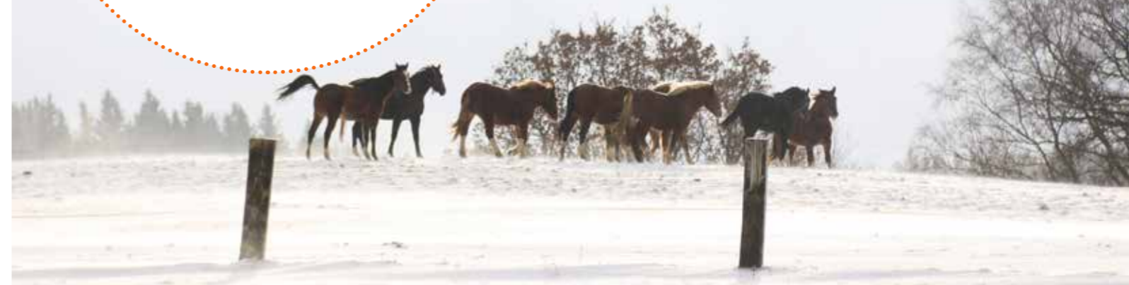
Hřebečci v testacích odchovně si užívají minutky zimního sluníčka střídané zimní vánicí aneb běžný život na Vysocině.