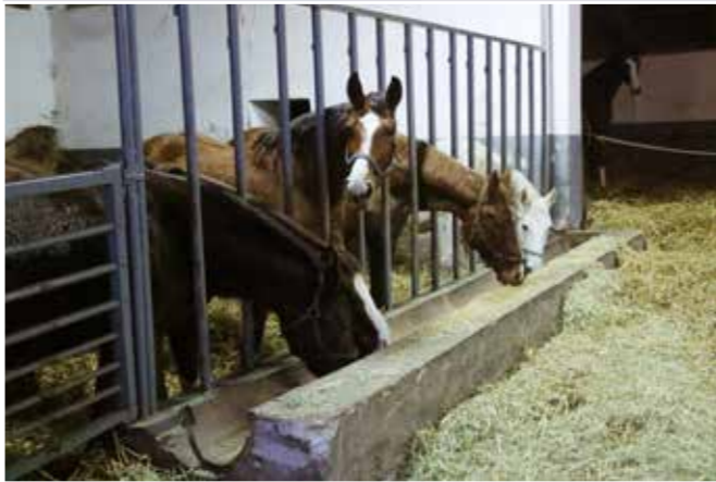
☛ Místní stáje se skupinovým ustájením.