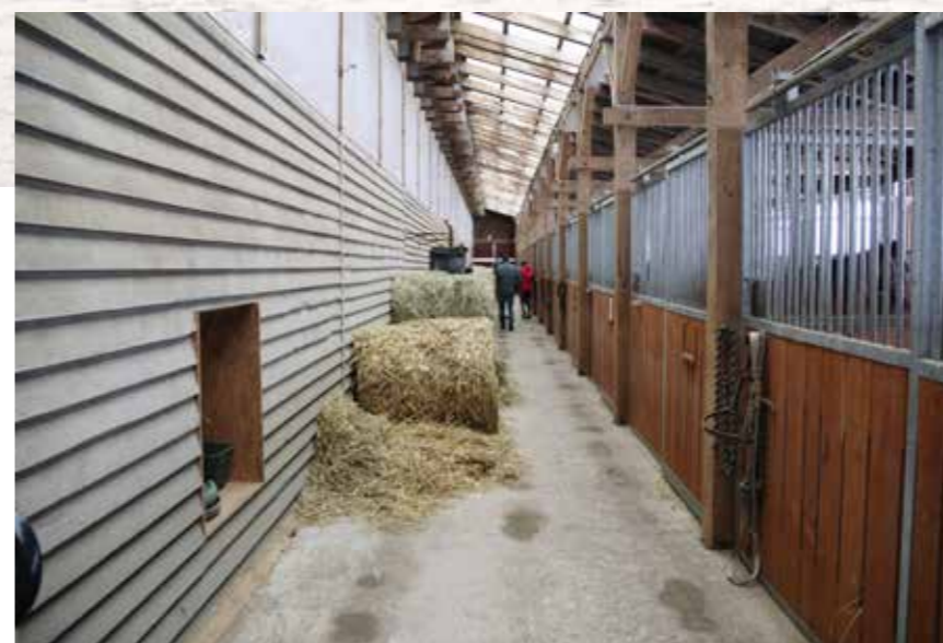
Boxy v jedné ze stájí umožňují průjezd a dají se tak vyklízet pomocí mechanizace.