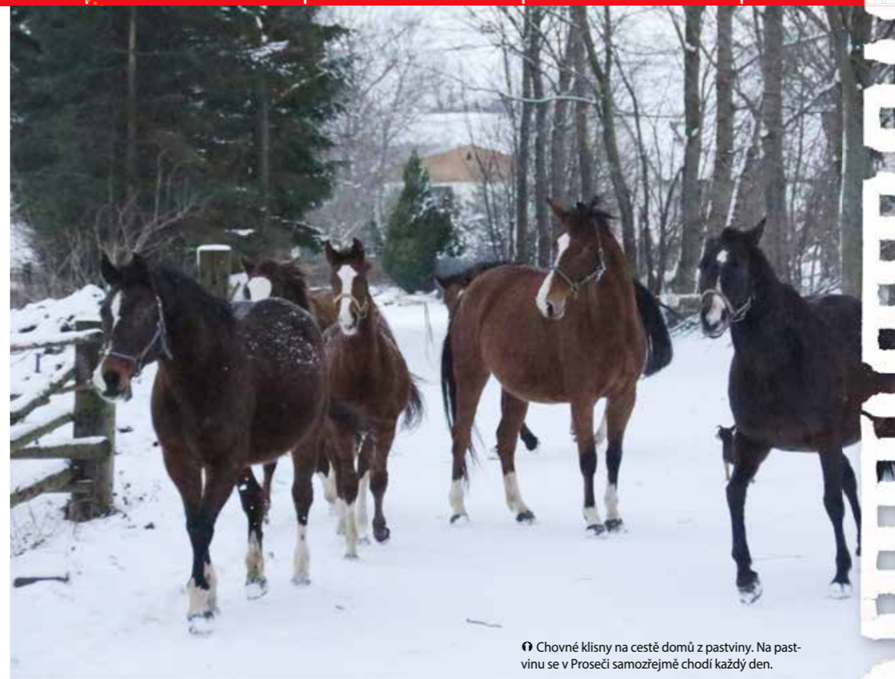
☛ Chovné klisny na cestě domů z pastviny. Na pastvinu se v Proseči samozřejmě chodí každý den.

se mu při práci na farmě hodí, naposledy si sami postavili kolotoč. Místní strojový park je bohatý, sami si suší seno i pěstují oves. Ovšem není mu lhostejný ani život v obci, takže pracuje v místním zastupitelstvu. Z akcí ho zase známe jako člena týmu předváděčů vyškolených Svazem chova-