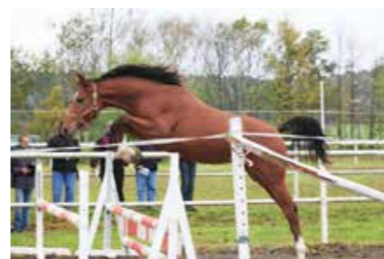
☛ Hecair 16-937 hf. čt.nar. 2013 po Heartbreak ZH, 16-380 Cairo po Caesar.

Svaz chovatelů českého teplokrevníka před Vánoci uvedl, že počty koní zapsané v této plemenné knize klesají, což dokazuje počet klisen v roce 2013 – celkem 10 004. Jiná situace je například ve druhé nejpčetnější plemenné knize, CS – Svaz chovatelů slovenského teplokrevníka v ČR zaznamenává nárůst: 2009 – 1955; 2010 – 2061; 2011 – 2195; 2012 – 2357; 2013 – 2444. PK slovenského teplokrevníka včetně české odnože je také na rozdíl od ČT členem Světové chovatelské federace sportovních koní (na další straně začíná profil světové jedničky podle WBFSH plemníka Kannan).