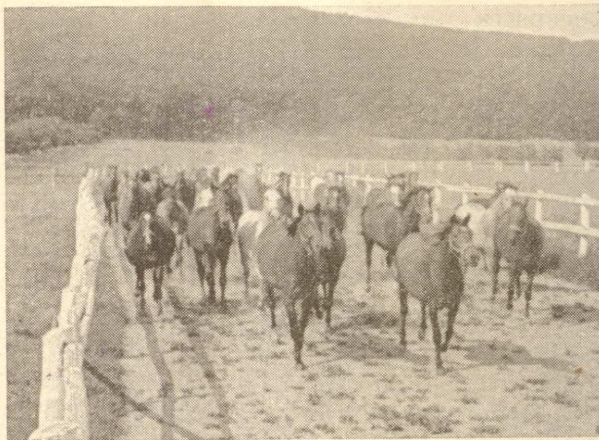
Regulovaný pohyb na dráhe upevňuje konštitučnú zdatnosť koňa.