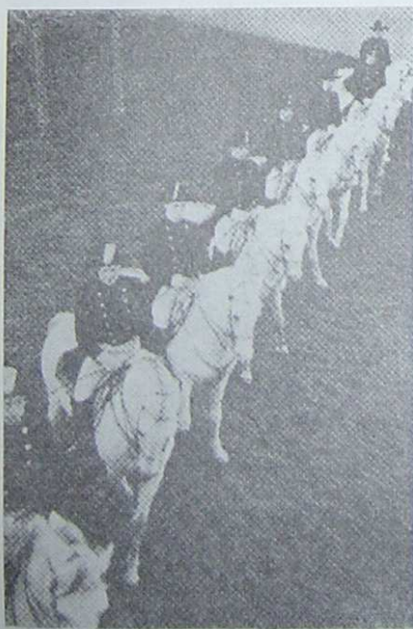
Z predstavenia Španielskej jazdeckej školy

Po troch až piatich rokoch sa stáva jazdec reiteradjunktom a jazdí už aj na predstaveniach na mladých žrebcov. Potom mu pridelia žrebca, ktorého musí sám pripraviť a predviesť ako svoju majstrovskú prácu. Popritom má naďalej služby v stajni a pripra-