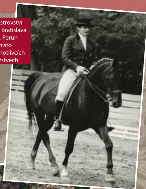
⇒ Mistrovství ČSSR Bratislava 1989, Perun – 1. místo v jednotlivcích i družstev