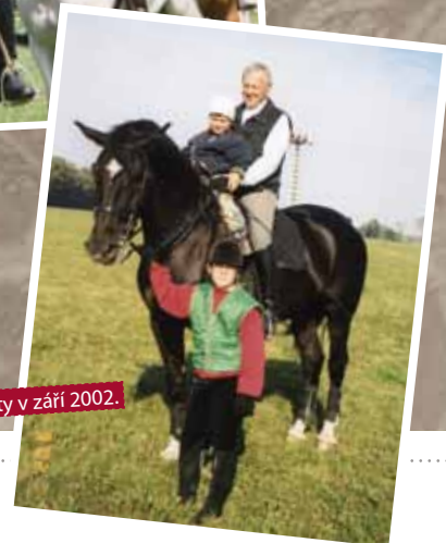
⇒ S vnučaty v září 2002.